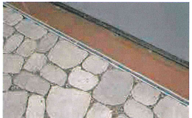
Oben: ARENA-NOVA® NR. 18 Grau-Schattiert Unten links: Wegeführung mit ARENA-NOVA®, Einfassung mit TEGULA® NR. 10 Naturgrau Unten rechts: Randabschluss ohne Schneiden mit ARENA-NOVA® NR. 18 Grau-Schattiert