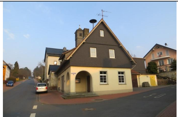
Umbauten und neue Verkehrsregelungen im und am Backhaus werden gewünscht