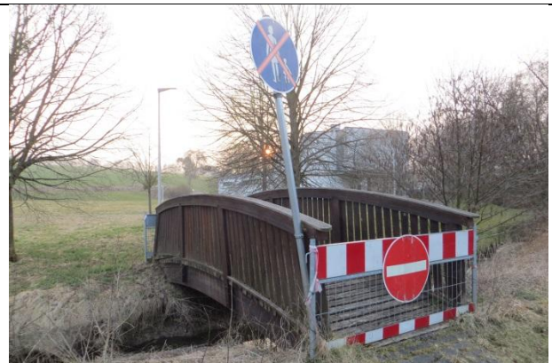
Holzbrücke über die die Kinder sicher zum Schulbus und zum Spielplatz kommen