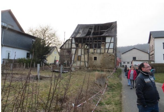
Könnte auf diesem Gelände eine neue Begegnungsstätte entstehen?