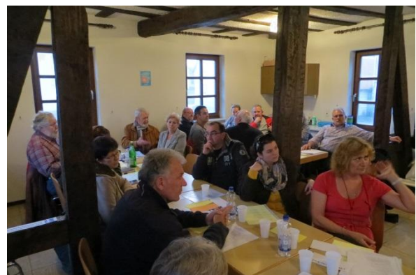
Trotz der Enge wird im Kirchensaal heiß diskutiert