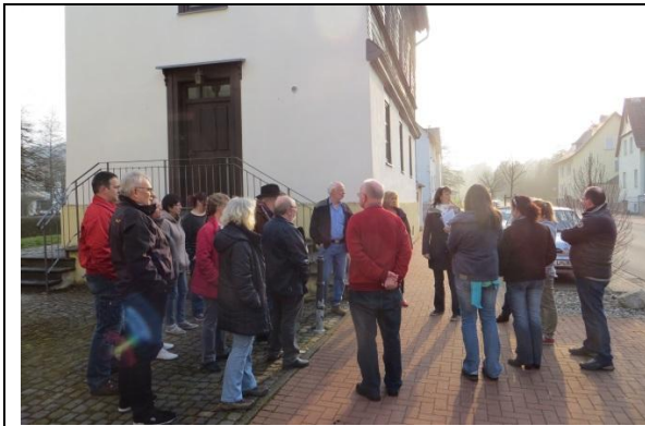
Es fehlt ein Versammlungsraum für größere Gruppen in Möttau