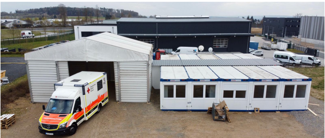
Bildunterschrift: Die neu eingerichtete Rettungswache im Investzentrum in Beselich.

Katastrophenschutz-Verwaltungsstab der Kreisverwaltung hatte sich für diese Maßnahme gemeinsam mit dem Deutschen Roten Kreuz Limburg ausgesprochen. Darüber hinaus wird ein Fahrzeug der Rettungswache in Weilburg räumlich an einen anderen Standort verlegt, damit auch im dortigen Ablauf möglichst wenig Kontakt der Fahrzeugbesatzungen untereinander stattfindet. Die Festlegung auf den Standort in der Region Weilburg ist noch nicht abgeschlossen, es wurden jedoch schon mehrere Alternativen ins Auge gefasst. Gleichzeitig hat auch das Land Hessen mit einem Stufenmodell auf mögliche Engpässe im Rettungsdienst reagiert. Auch am Rettungsdienst selbst geht die allgemein angespannte Situation zum Erwerb von persönlicher Schutzausrüstung nicht spurlos vorüber. Die Arbeit nah am Patienten setzt die Mitarbeiterinnen und Mitarbeiter einem großen Infektionsrisiko aus, dies gilt es zu verhindern. Das Deutsche Rote Kreuz Limburg und Oberlahn sowie der Malteser Hilfsdienst sind für Spenden von Schutzausrüstung dankbar. Wer beispielsweise über Masken der Arten FFP2 oder FFP3 oder auch Schutzkittel verfügt, kann diese für die Sicherheit der Mitarbeiterinnen und Mitarbeiter zur Verfügung stellen.